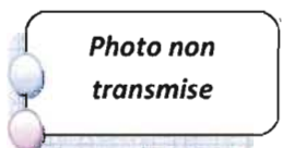
Alain LIARD Conseiller municipal